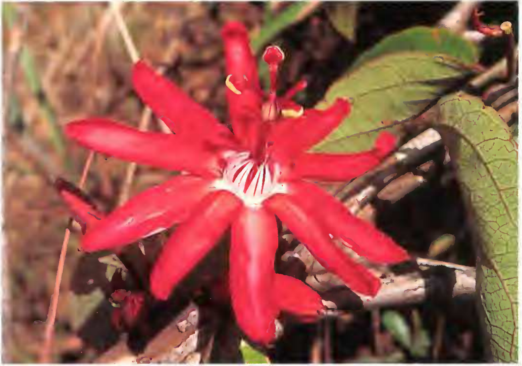
Fig. 2. — Passiflora aimae Annonay & Feuillet.